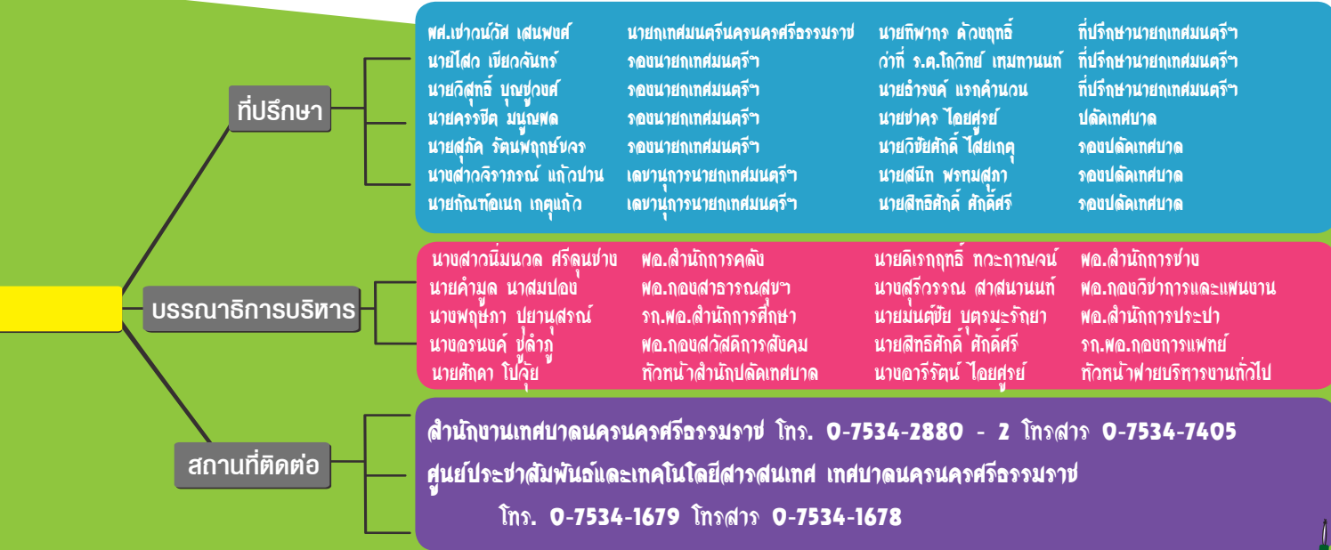
(ยศ.เจ้าอาวาส เสงี่ยมวงศ์) นายกเทศมนตรีนครนครศรีธรรมราช